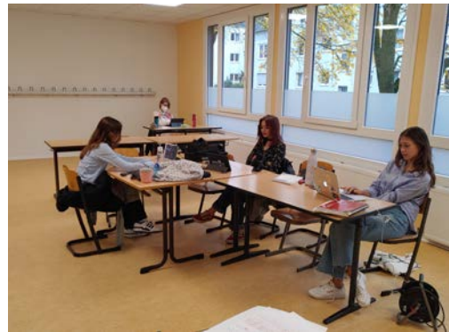
Delegates of Finland (Economic and Social Council) and Sudan (Political Committee)