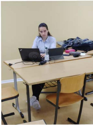
Delegate of Qatar in the Disarmament Committee